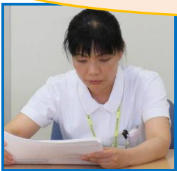
事務局会議の報告をする WLB 担当副総師長と三役の様子